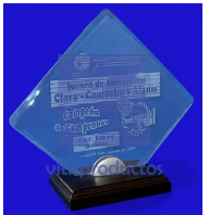
MOD. ESP 011 cristal en 6mm. con acabado en canto pulido facetado con una base de madera