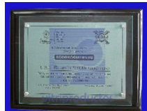
ESP 046-B Placa de cristal tamaño carta esmerilada montada sobre base de poliéster color vino de 28 x 35 cm.