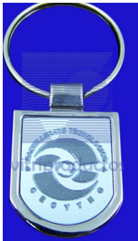
LLAVERO ESCUDO Llavero cromado con centro de aluminio plata mate grabado con punta de diamante.