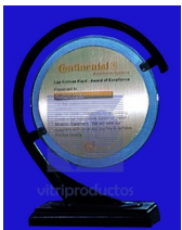
MOD. ESP 299-A Cristal de 19 cm. de diámetro en cristal tintex de 9 mm. con placa de aluminio impreso montado en base metálica color negro.