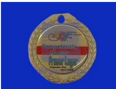
MOD MED. 029 ELABORADO EN METAL FUNDIDO DISPONIBLE EN COLOR ORO, PLATA Y BRONCE, CON DIAMETRO EXTERIOR DE 6.5 CM. Y DIAMETRO INTERIOR DE 5CM. CON RECUBRIMIENTO DE RESINA.