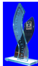
ESP 098 RECONOCIMIENTO EN CRISTAL C/FORMA DE "S" ENTONTRADA. CRISTAL REFLECTA Y CRISTAL CLARO EN BASE DE CRISTAL