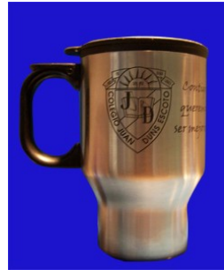
TERMO DE ACERO GRABADO