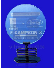
ESP-010 Trofeo o reconocimiento elaborado en cristal claro de 9mm con base color negro. Medidas 22 X 15 Cm.