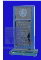
MOD ESP 003 Fabricado en cristal de 19mm claro con cristal reflecta bronce de 6mm. biselado en dos piezas