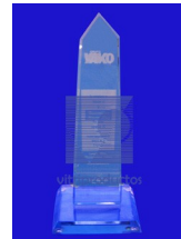
MOD. ESP 028 Elaborado en Cristal de 13 mm. cuenta con dimensiones de 15x15x35 cm. base de cristal de 19mm. con bisel cubano