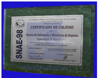
ESP-120 Placa de mármol de 40 x 56 cm. con placa de acero inoxidable grabada al centro