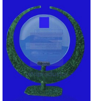
MOD. ESP-115 trofeo elaborado en cristal de 9mm. de espesor, medidas totales de 21 x 23 cm.