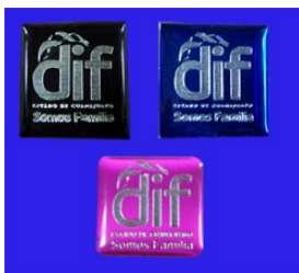
PINS DE ALUMINIO DE COLOR METALIZADO (disponible en rojo, negro, azul, magenta, morado) GRABADO CON PUNTA DE DIAMANTE Y ENCAPSULADO.