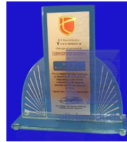
MOD. ESP 305 Reconocimiento de cristal de 9mm.de compuesto por tres piezas y base de cristal con aluminio impresa dorada.