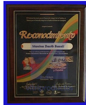
MOD ESP 308 PLACA DE ALUMINIO IMPRESO EN BASE MDF. COLOR CAFE IMITACION MADERA DE 20 X 25 CM.