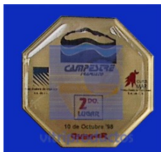
MOD. MED 015 Medalla de aluminio impreso encapsulada al frente en forma de octógono con medida exterior de 7.5 cm.