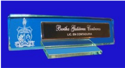
ESP 061 LETRERO DE ESCRITORIO CF9 30X8 CPF C/REFLECTA BISELADO 8X20