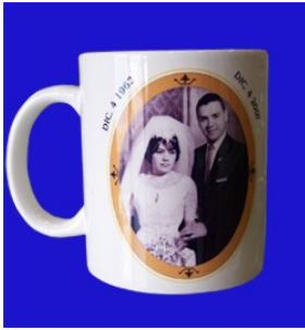
TAZA IMPRESA Taza disponible únicamente en color blanco, a comparación de las otras tazas esta no limita el diseño ya que pueden ir degradados, sombras e incluso una fotografía.