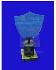
MOD. ESP 015 Cristal en forma de escudo fabricado en cristal de 9mm.montado sobre una combinación de base cilíndrica con cuadrada.