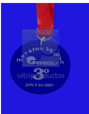
MEDALLA DE CRISTAL REFLECTA Medalla de cristal tipo espejo de 7.5 cm. de diámetro fabricadas en cristal de 6mm. con grabado en Sand Blast. y listón