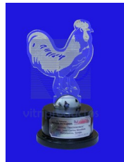
MOD. ESP 068 Base de madera color verde con placa metálica impresa y logotipo en la parte de arriba cortado y grabado en acrílico de 9mm