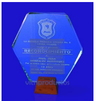
MOD. ESP 040 Fabricado en cristal de 9mm Canto Pulido Facetado Base de Madera o Cristal