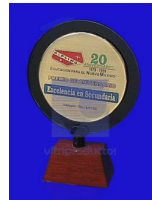
MOD ESP 119 Luna filtrasol de 6mm. de 12 cm. de diámetro con placa de aluminio impreso encapsulado y base de madera