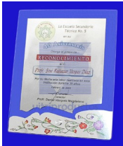
MOD ESP 320 Placa de cristal de 6mm. de 20 x 25 cm. con placa plateada al centro y diseño de guía en la parte de abajo y soporte de aluminio