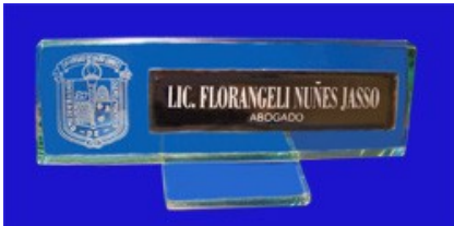
ESP 060 LETRERO DE ESCRITORIO DE CRISTAL 8X25 C/REFLECTA 4X16