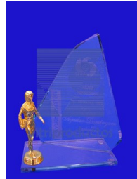
ESP -025 Trofeo o Reconocimiento de cristal de 9mm.forma velero 2 y base de cristal de 9mm. de 10x20 cm. Con figura de plástico dorada según el evento