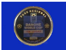
MOD. MED 008 Medalla fabricada en aluminio de 50mm impreso y encapsulado por la parte de enfrente.