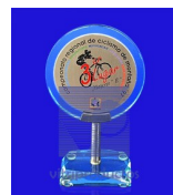
MOD. ESP-007 Fabricado en cristal de 9mm. con diámetro de aluminio impreso, base de cristal de 19mm. y acero.