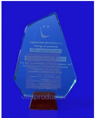
Mod. ESP 039 Cristal claro de 9mm. Acabado en canto pulido facetado o recto. Base de cristal o de madera