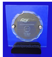
MOD ESP 153 Combinación de cristales de 9mm. cuadrado y redondo, combinado con aluminio impreso y chapetones de aluminio Medida 20 x 22 cm.