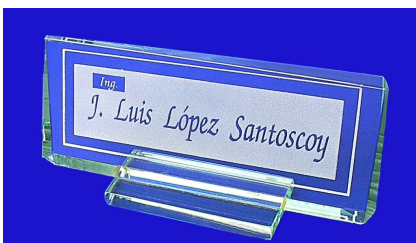
ESP 059 LETRERO PARA ESCRITORIO CRISTAL 9MM 8X20