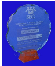
MOD ESP 127 Cristal de 9mm de diámetro de 19 cm. desconchado con base de madera