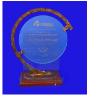
MOD. ESP 299 Elaborado en cristal de 9 mm. de 19 cm. de diámetro con base metálica de 1/2 " de espesor disponible en Color dorado.