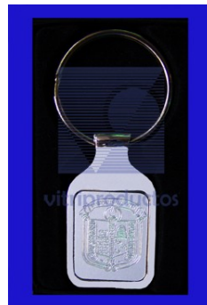
LLAVERO CUADRADO Llavero cromado con centro de aluminio plata mate grabado con punta de diamante.