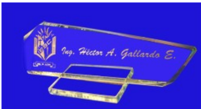
ESP 063 LETRERO DE ESCRITORIO CRISTAL 9MM DE 8X24 CPF TIPO FLECHA