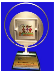
ESP 108 Fabricado en placa de acero cal. 14 con acrílico de 6mm. y base de madera con placa de aluminio impresa.