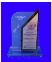
MOD. ESP 145 Reconocimiento de cristal de claro 6 mm. grabado, combinado con cristal reflecta de 6 mm. con placa de aluminio impresa y base de cristal. 26cm x 20cm