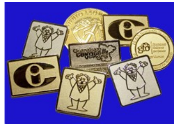
PINS TROQUELADOS, ACABADO EN COLOR ORO, PLATA O BRONCE.