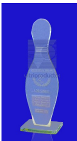
MOD. ESP 023 Cristal en forma de pino de Boliche Elaborado en cristal de 9 mm. medida de 8 x 27 cm. acabado con canto pulido recto