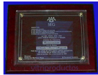
ESP 046 Placa de cristal tamaño carta grabada en sand blast montada sobre base de poliester color vino de 28 x 35 cm. con chapetones de latón en las cuatro esquinas.