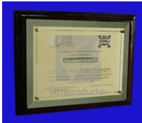
MOD ESP 012 Placa de Cristal Esmerilado tamaño carta con fondo dorado montada sobre base de poliester color tabaco de 28 x 35 cm con chapetones en las cuatro esquinas.