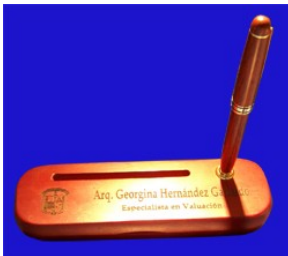
PLUMA DE MADERA CON CAJA PORTATARJETERO Pluma de madera grabada en laser con caja de madera igual grabada en laser