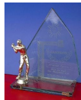
MOD. ESP-026 Trofeo o reconocimiento de cristal de 12.7 mm. canto pulido recto en forma de velero y figura de plástico dorada según el evento