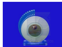
CARACOL Reconocimiento en cristal de 6mm. Compuesto por 5 piezas. Medidas de 22.5 x 21