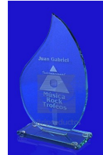
MOD ESP 021 Cristal en forma de gota fabricado en cristal de 9mm. de 16 x 25 cm. montado en base de cristal o de madera.