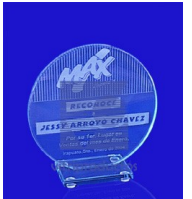
ESP 042 Cristal de 9mm de espesor en un diámetro de 17 cm. Canto Pulido Recto Base de cristal o Madera