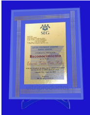
MOD ESP 049 Placa de cristal de 9mm. de 22 x 28 cm. con líneas grabadas en color dorado con placa de aluminio impreso al frente y colgadera en la parte trasera del cristal.