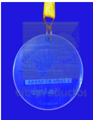
MEDALLA CLARA Fabricada en Cristal claro de 6mm con canto pulido y grabado en sand blast.