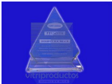
ESP 024 Elaborado en crista de 13mm Acabado en Bisel Cubano Base de cristal o Madera