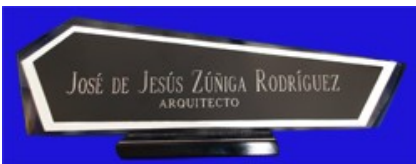
ESP 060 B LETRERO ESCRITORIO FLECHA FILTRASOL CANTO PULIDO FACETADO C/ALUMINIO PLATA Y ALUMINIO NEGRO GRABADO EN EL PANTOGRAFO CON DIAMANTE