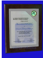
ESP 309 Placa de Aluminio impreso mate con contornos en aluminio brillante tamaño carta montada sobre base de madera con logotipo en latón encapsulado.